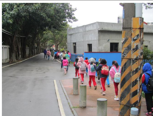
說明：二年級認識社區交通狀況