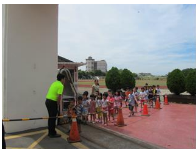
說明：一年級路隊訓練