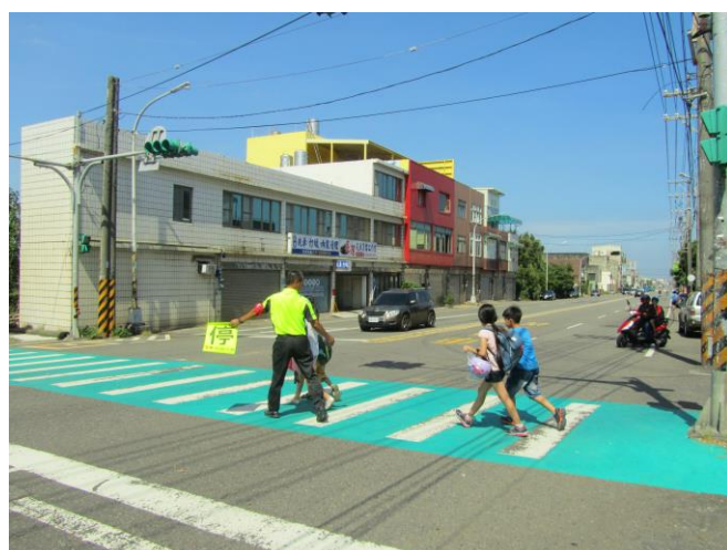
說明：四年級易肇事路況認識