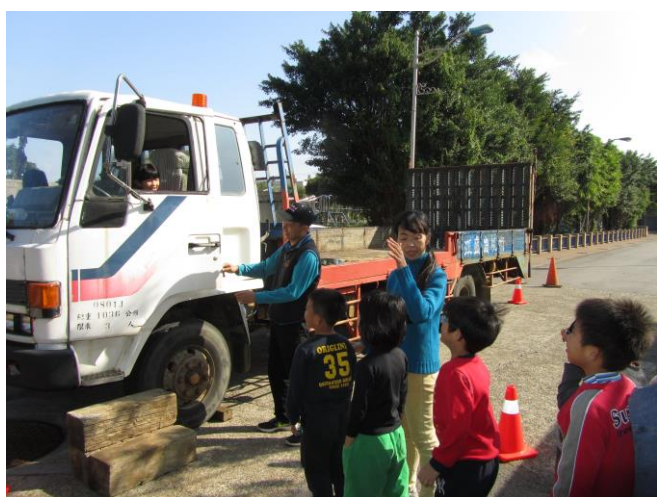
說明：三年級內輪差教學