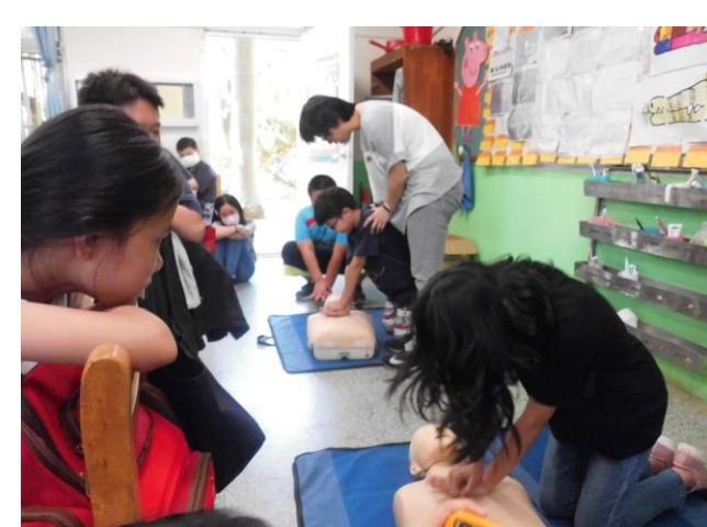
說明：六年級簡易急救訓練