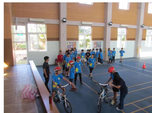
說明：五年級自行車檢定